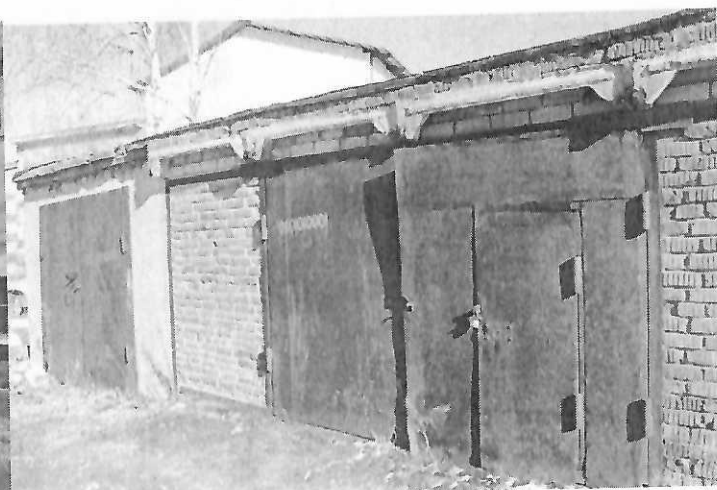
Фото № 2 (Гараж г. Вологда, ул. Добролюбова, д. 6 )