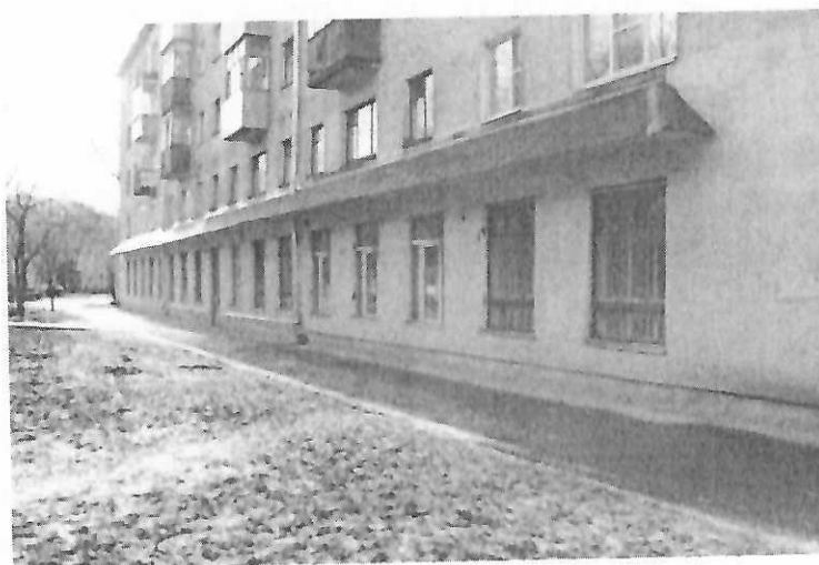
Фото № 3 (Нежилые помещения №№1-36,6а, 26а,29а, находятся на 1 этаже пятиэтажного кирпичного жилого дома со встроенными нежилыми помещениями г. Вологда, ул. Некрасова, д. 60)